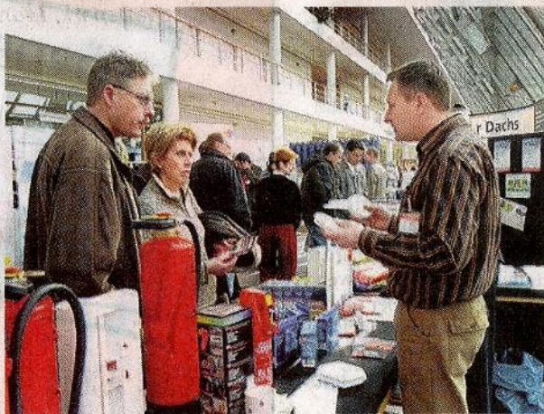
Bereits zum sechsten Mal können sich Besucher beim Immobilien- und GE-WOHN-GUT informieren.

Weitere Informationen im Internet: www.ge-wohnt-gut.de .