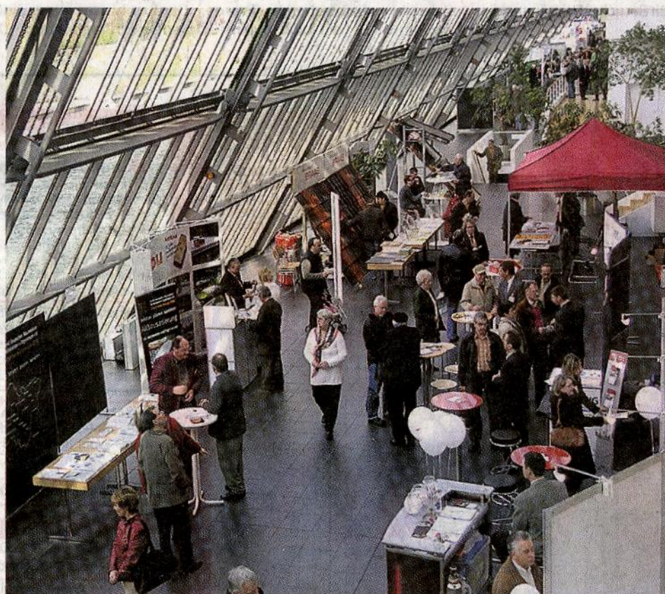
Gut besucht war der 6. Immobilientag im vergangenen Jahr. Die GE-WOHLT-GUT zieht immer zahlreiche Besucher an.