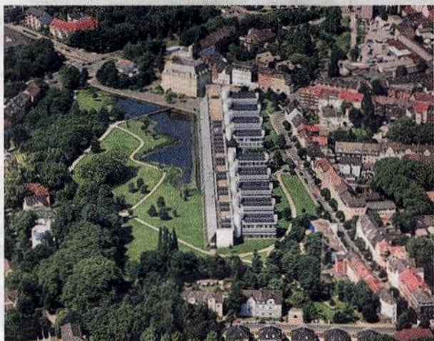
Mittlerweile ein Wahrzeichen für Gelsenkirchen: der Wissenschaftspark in Ückendorf.

Die Beratungsangebote und weitere Informationen zum Solardachkataster sind zu erhalten bei der Stadt Gelsenkirchen. Ansprechpartner ist Uwe Behrendt unter ☎ (0209) 167-4600 oder per Mail unter uwe.behrendt@gelsenkirchen.de