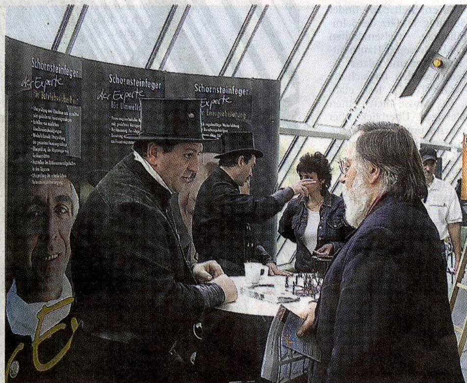
Im vergangenen Jahr informierten auch die Schornsteinfeger zu den Themen Betriebssicherheit, Umweltschutz und Energieberatung.

kationsangebote. Die Polizei mit dem Netzwerk der Schutzgemeinschaft „Zuhause sicher“ runden das umfangreiche Messeangebot ab.